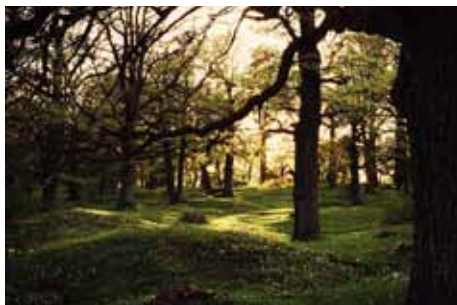
Gravfältet Norra Malma, som ligger strax bredvid Vikingabyn Storholmen.

En annan bra tjänst RAA har är Kulturmiljösök, som är en ny webbtjänst som gör det lättare för alla att hitta information om historien i landskapet.